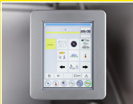
TSCA SAFETY TOUCH: panel de control táctil sencillo y claro