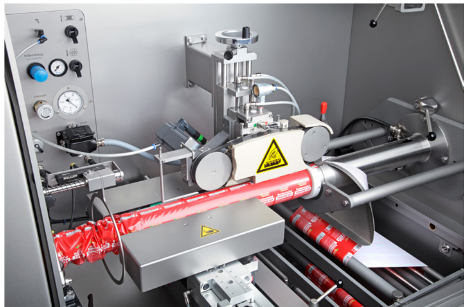
Estación de sellado en caliente de la TSCA para un sellado fiable

El sistema completo formado por una máquina grapadora, grapas y cordeles, todo en uno, asegura una producción eficiente y sin fallos. Las grapas originales de Poly-clip System garantizan la máxima calidad. La fabricación se somete a las más estrictas pruebas de calidad. Con certificación en conformidad con ISO 22000 e ISO 9001, están hechas a la medida exacta del proceso de producción. La tecnología SAFE-COAT de Poly-clip asegura una producción sin fallos y la tranquilidad de un revestimiento de seguridad apto para alimentos, certificado por el SGS INSTITUT FRESENIUS. Poly-clip System es el proveedor líder a nivel mundial de soluciones de sistemas de grapado.