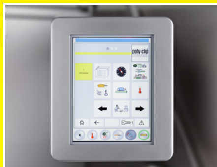
Панель TSCA SAFETY TOUCH простая и логичная