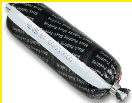
Маркировка продукта наносится непосредственно на пленку