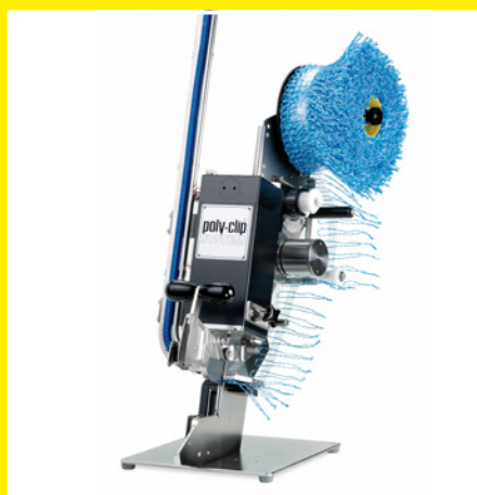
Versión con cuchilla neumática y GSE (dispositivo para colocar cordeles)

del grapado. La presión de grapado puede ser ajustada en cada caso mediante un escalado con muescas. Además permite regular la velocidad y la fuerza de cierre mediante un estrangulador-reductor de presión.