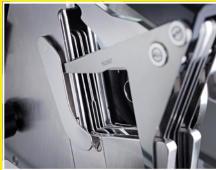
Tijeras se pueden ajustar al calibre de cada producto para un número de ciclos elevado