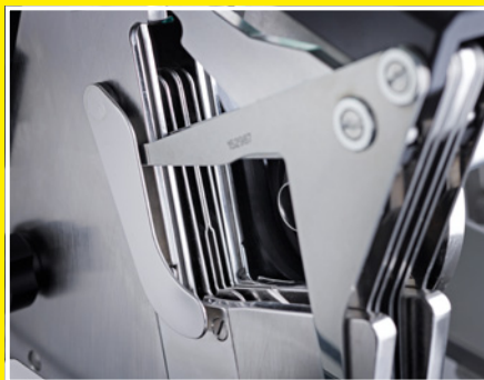
Verdränger an Kaliber des Produktes anpassbar – für höhere Taktzahlen