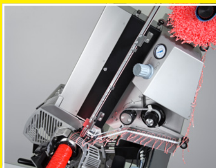
El dispositivo automático de cordel GSE está montado en la parte derecha de la máquina.

La grapadora automática se acopla mecánicamente y eléctricamente a la embutidora. Durante el cierre automático de las tijeras, el producto se separa y la tripa se centra para ser cerrada de forma segura con el sistema de doble grapa. La tripa puede ser cortada automáticamente al mismo tiempo por la cuchilla neumática a través de la función de control de ristas. Para colgar embutidos, se puede insertar y grapar automáticamente un cordel gracias al dispositivo opcional de cordel GSE. La disposición ergonómica de los elementos hace el manejo de la máquina sencillo y cómodo. La porción de peso preestablecido es proporcionada por la embutidora usando los botones de llenado/grapado y se cierra por grapado automáticamente.