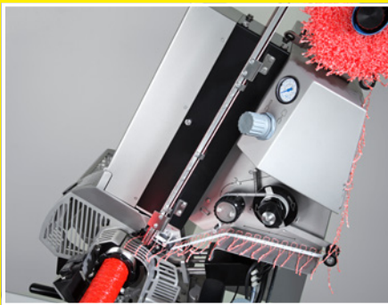
Gurtschlaufeneinleger GSE ist rechts an der Maschine befestigt.

Die Clipmaschine ist mechanisch und elektrisch mit dem Füller gekoppelt. Beim Schließen des Verdrängers wird der gefüllte Darm an der Verschlussstelle zentriert, das Brät verdrängt und im Doppelclip-Verfahren verschlossen. Gleichzeitig kann der Darm automatisch über die Funktion Vorwählzähler für Kettenwürste mit dem pneumatischen Abschneidmesser durchtrennt werden. Zum Aufhängen der Würste können Schlaufen automatisch mit dem optionalen Gurtschlaufeneinleger GSE eingeklippt werden. Die Maschinenbedienung ist einfach und komfortabel durch ergonomisch angeordnete Bedienelemente. So kann auch über die Bedientasten direkt am Füllrohr die zuvor eingestellte gewichtsgenaue Portion vom Füller abgerufen und automatisch verclippt werden.