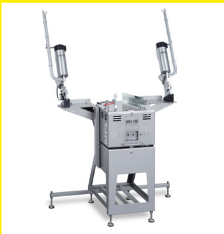
MPL con bastidor y grapadoras de una sola grapa EZ 4500 para diestros y zurdos