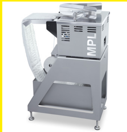
MPL con alimentación neumática de bolsas con cinta para una producción aún más eficiente