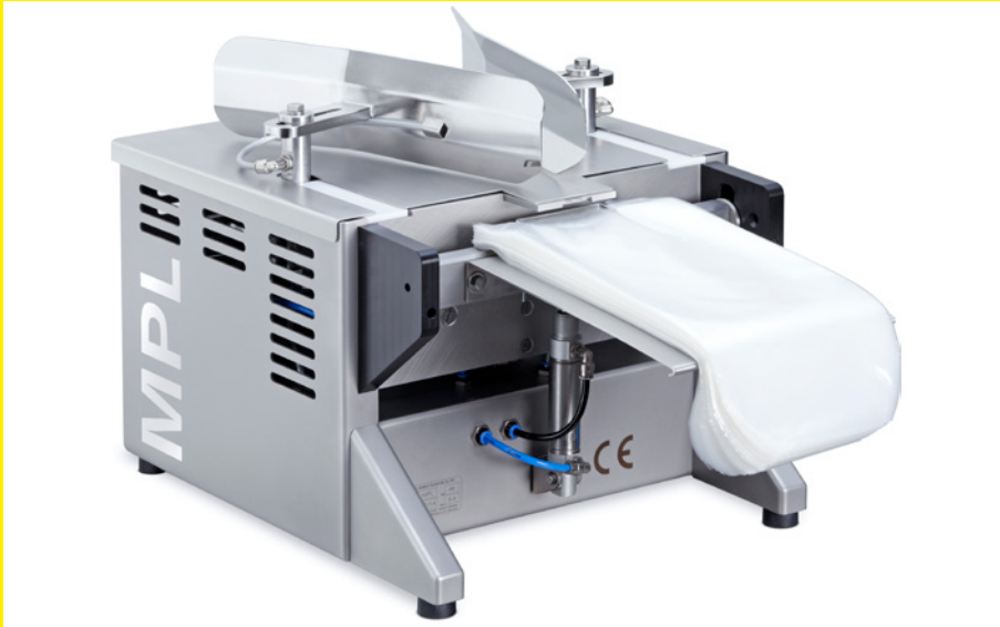
Version estándar de la MPL para bolsas en pila