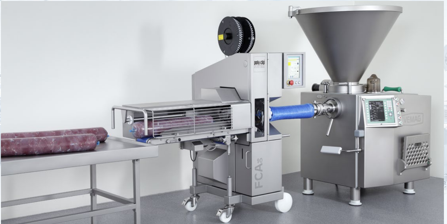
Leistungsstark für große Kaliber