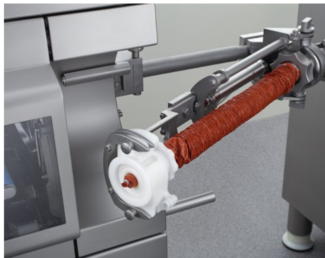
Darmbremsassistent - halbautomatisches Darmbremshaltersystem