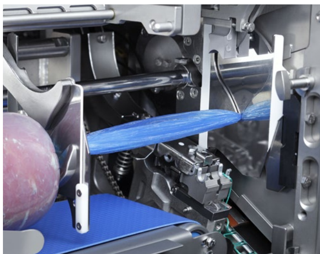
Überspreizung für luftfreie Lockerfüllung von Formprodukten