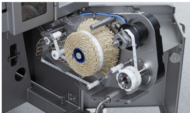
Einfacher Schlaufenwechsel durch ausschwenkbaren GSA