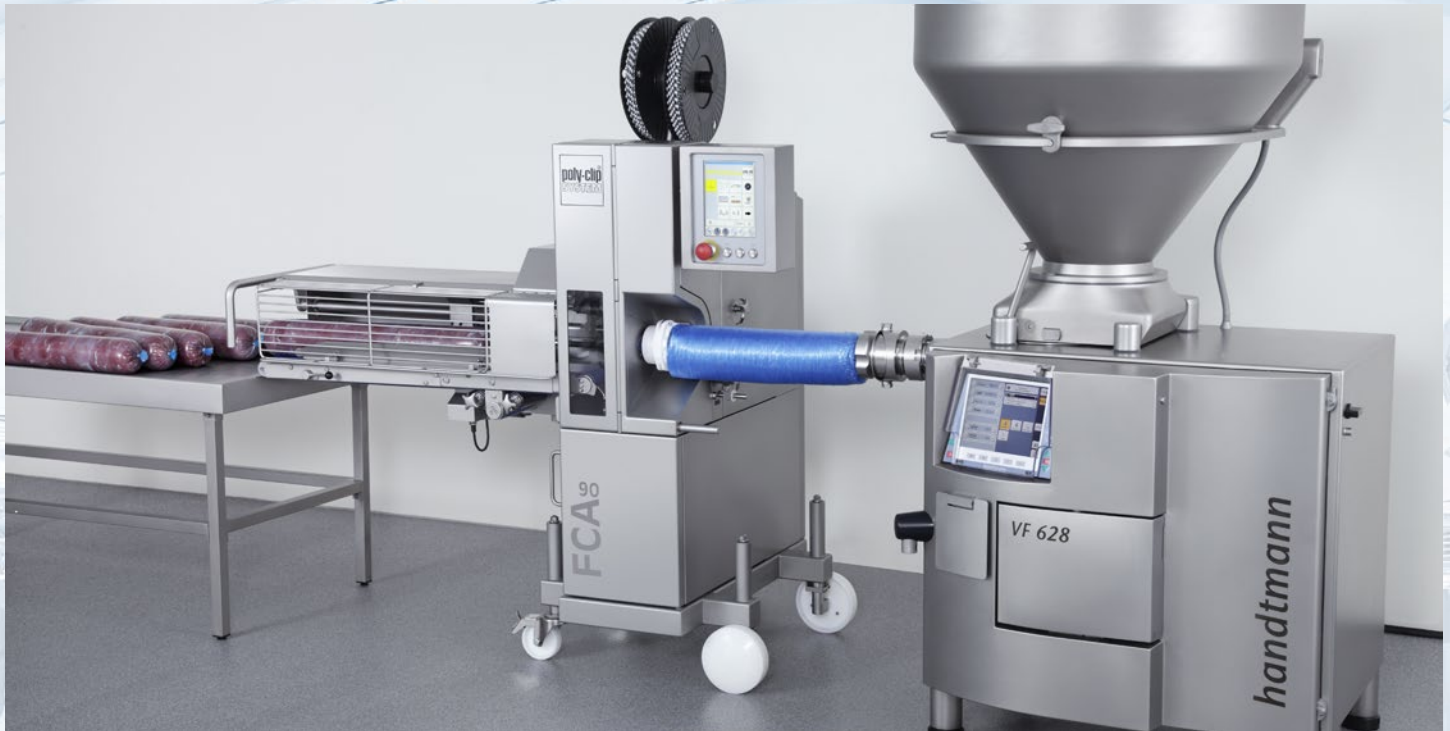
Vielseitig bei Portionswurst, Aufschnitt und Schinken