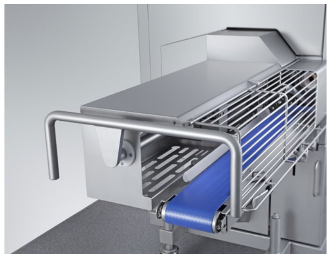
Kalibertreues Produkt durch regelbare Förderbandgeschwindigkeit

Das komplette System aus Clipmaschine, Clips und Schlaufen aus einer Hand sorgt für eine effiziente und störungsfreie Produktion. Original Clips von Poly-clip System garantieren höchste Qualität. Die Herstellung unterliegt strengsten Qualitätsprüfungen. Zertifiziert nach ISO 22000 und ISO 9001 sind sie passgenau auf den Produktionsprozess abgestimmt. Die Poly-clip SAFE-COAT Technologie sichert durch eine lebensmittelechte Sicherheitsbeschichtung, überprüft durch das SGS INSTITUT FRESENIUS, eine störungsfreie Produktion und ggf. eine zweifelsfreie Produkthaftung. Poly-clip System ist der weltweit führende Anbieter von Clip-System-Lösungen.