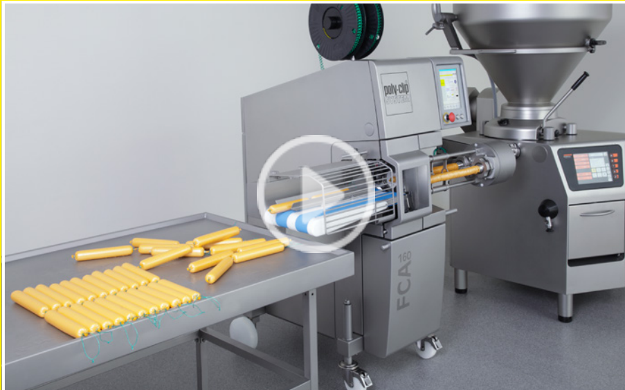
Elevado rendimiento para grandes calibres - FCA 160