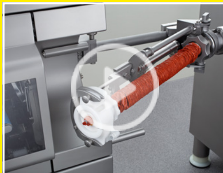
Darmbremsassistent - halbautomatisches Darmbremshaltersystem