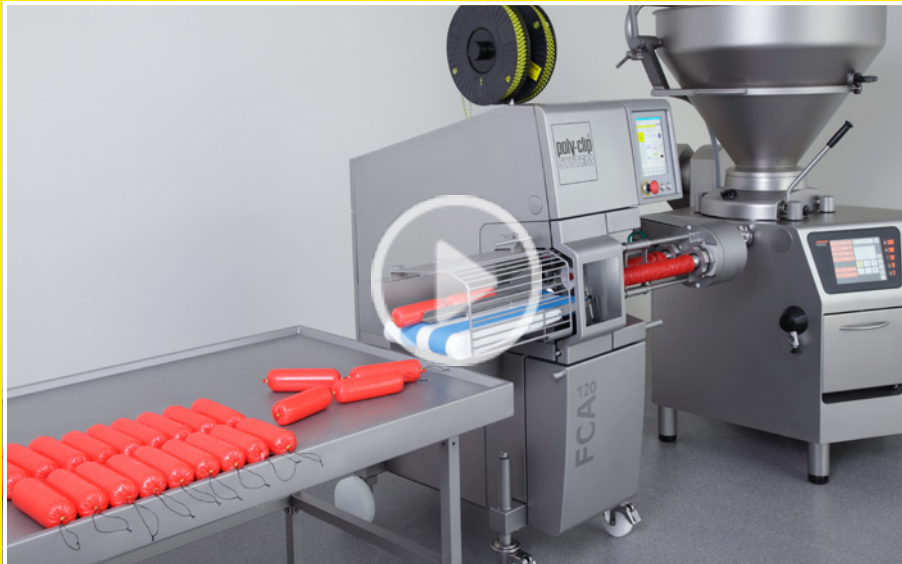
FCA 120 – der Spezialist für Höchstgeschwindigkeit im Kaliberbereich bis 120 mm