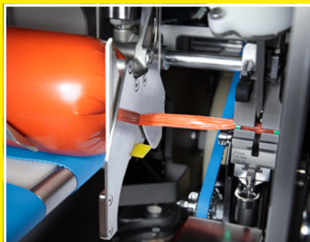
Überspreizung für luftfreie Lockerfüllung von Formprodukten