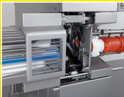
Kürzeste Rüstzeit durch Komfortöffnung der Frontklappe