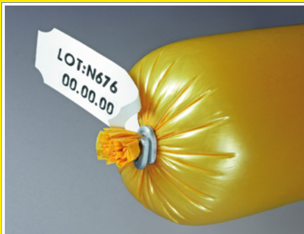
Fácil y seguro: marcado mediante etiquetas impresas